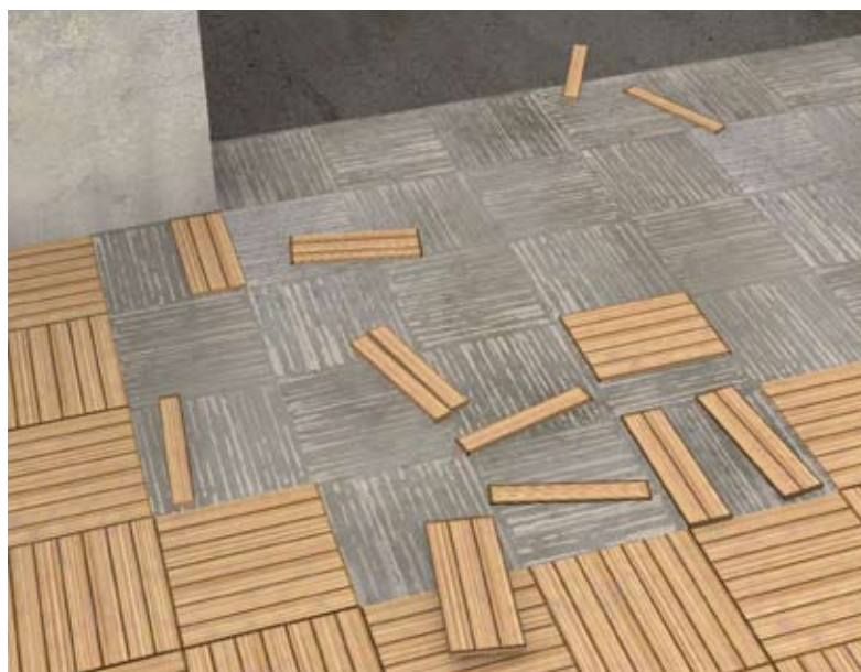
Décollement généralisé d'un parquet mosaïque collé sur béton.

Les revêtements de sol ont une fonction décorative et sont très sollicités par les déplacements des personnes et des objets. Il en existe une très grande variété intégrant des produits minéraux (carrelages, pierres), organiques (bois), synthétiques (peinture, revêtements plastiques ou textiles). Leur mode d'application ou de fixation au plancher dépend de leur nature : scellement, collage, clouage sur une ossature, application directe en couche mince d'une peinture.