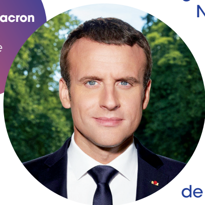
Emmanuel Macron président de la République

“L’éducation est le premier terrain de cette bataille pour la mobilité géographique et sociale (...).