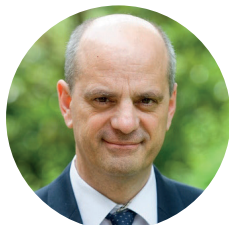
Jean-Michel Blanquer ministre de l'Éducation nationale et de la Jeunesse

80 territoires éligibles ont été sélectionnés après un travail fin avec les préfets et les recteurs. Nous proposons désormais aux collectivités, sans qu'il ne se fera, de s'engager dans cette démarche, au travers de l'élaboration d'une stratégie territoriale ambitieuse et partagée. L'État sera là pour les accompagner avec près de 100 millions d'euros engagés sur les trois prochaines années et l'engagement de toute la communauté éducative.