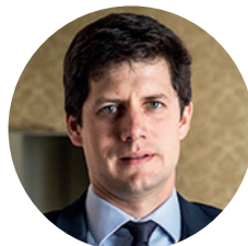
Julien Denormandie ministre auprès du ministre de la Cohésion des territoires et des Relations avec les collectivités territoriales, chargé de la Ville et du Logement