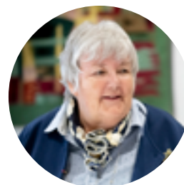
Jacqueline GOURAULT Ministre de la Cohésion des territoires et des Relations avec les collectivités territoriales

Les concertations, qui seront menées dans chaque région avec les élus locaux et les acteurs de la société civile permettront de faire émerger de nouvelles propositions adaptées à chaque territoire, dont je ne doute pas qu'elles viendront alimenter la richesse de cette nouvelle relation de confiance entre État et collectivités territoriales qu'il nous appartient de bâtir, ensemble.